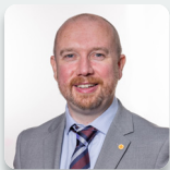
Mabon ap Gwynfor AS Plaid Cymru