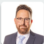
Hefin David AS Llafur Cymru

Mynychodd yr Aelodau a ganlyn fel dirprwyon yn ystod yr ymchwiliad hwn: