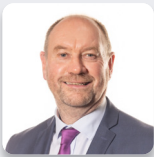
Cefin Campbell AS Plaid Cymru