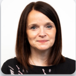
Cadeirydd y Pwyllgor: Buffy Williams AS Llafur Cymru