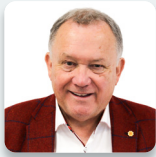
Lindsay Whittle AS Plaid Cymru