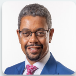
Vaughan Gething AS Llafur Cymru